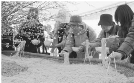
ほんのりピンク色の梅うどんは毎年人気です

町・幸町・中央町・南沢・学園町・ひばりが丘団地・南町・前沢一～三丁目 費100円(茶菓子代など)⑥中部地域包括支援センター ☎470・8186へ ◎西部地域に居住の方 日3月25日(月)午後1時15分～2時半⑦西部地域センター講習室2⑧前沢四～五丁目・滝山・野火止・八幡町・柳窪・弥生・下里 費100円(茶菓子代など)⑨西部地域包括支援センター ☎472・0661へ 交通事故や労務災害により親御さんを亡くされた世帯の方へ(交通・労務災害遺児サポート事業) 交通事故や労務災害により父母のどちらか、または両親を亡くされた市内在住の方に進級祝い金、入学準備金を差し上げます。ただし、生活保護世帯は除きます。 ◎「進級祝い金」 日4月に進級する小学新2年～新6年生と中学新2・3年生の児童・生徒 ▼進級祝い金額 お子さん1人に対し、1万円 ◎「入学準備金」 日4月に小・中学校、高等学校(技能修得を目的とし、就学期間が1年以上の各種学校を含む)へ入学する方 ▼入学準備金額 小学校が4万8,000円、中学校が5万4,000円、高等学校が12万円 ▼受付時に必要な書類 いずれも①交通事故(自動車安全運転センター事務所長発行)または労務災害(労働基準監督署長発行・遺族補償年金決定など)を証明する書類の写し②戸籍謄本③入学許可書(高等学校に入学する方のみ)④通帳⑤お子さんの生年月日が分かるもの <共通事項> ▼申請期間 3月11日(月)まで ▼申請受付会場 社会福祉協議会(わくわく健康プラザ2階。土曜・日曜を除く午前9時～午後5時)、中央町地区センター(火曜を除く午前9時～午後5時) ⑩同協議会 ☎473・0294 東久留米市ファミリー・サポート・センター事業説明会 地域で子育てを応援する有償の活動 利用したい方、協力したい方合同の説明会です。4月から「保育園・学童保育所への送迎が間に合わなくなる」という方は、ご登録をお勧めします。地域の子育てをお手伝いして下さる協力者も募集中です。