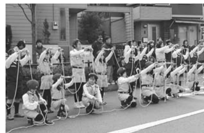
今年の消防団出初式で、ロープ技術を披露する「消防少年団」

消防少年団は、心身ともに大きく成長する小学生から中学生に至る年代に、社会のさまざまな仕組みを学ぶとともに、防火・防災意識の向上と、防災行動の基本を身につけるために各種活動を行います。