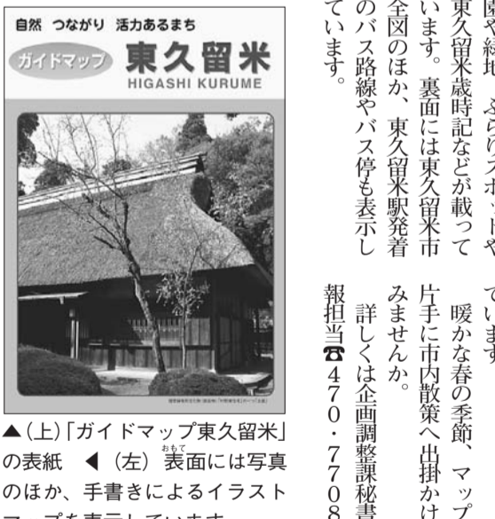
▲(上)「ガイドマップ東久留米」の表紙 ▲(左) 表面には写真のほか、手書きによるイラストマップを表示しています

市の案内図「ガイドマップ東久留米」は、年1回改訂され、3月から新しくなります。表のイラストマップには、市内各地域に点在する公園や緑地、ぶらりスポットや東久留米時記などが載っています。裏面には東久留米市全図のほか、東久留米駅発着のバス路線のバス停も表示しています。