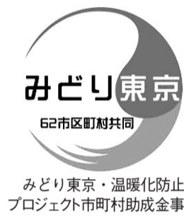
みどり東京 62市区町村共同 プロジェクト 温暖化防止 環境政策課

市環境フェスティバル実行委員会と市では、身近でできるエコ活動の普及・啓発のため、普段家族や地域、企業、学校などのグループや個人で取り組んでいる環境保全、省エネなどの活動を募集します。応募された活動内容を記した用紙を6月8日(土)・9日(日)開催の環境フェスティバルで掲示し、フェスティバル来場者に「ために」なる一面に「水を取って下さい」。