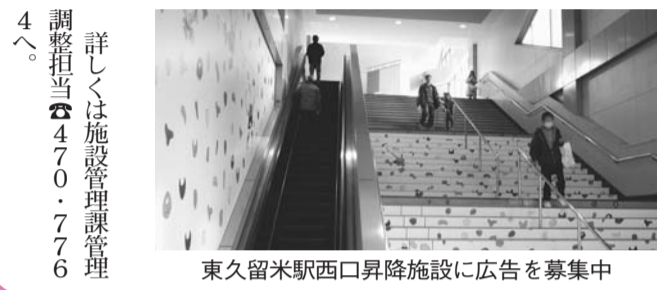
東久留米駅西口昇降施設に広告を募集中

東久留米駅西口昇降施設は駅舎に通じる市の施設として、市民の皆さんに利用していただいています。現在、同施設の壁面に有効利用することを目的に、有料広告を募集しています。広告の規格、1ヵ月当たり、広告掲載料金は以下の通りです。