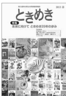
◀ときめき第50号の表紙

④発行日は3月29日 ④特集＝「未来に向けて ときめき25年の歩み」 ④50号記念インタビュー＝男女共同参画、これだけは世界中が争わず、「横のつながり」を持つことができる ④情報ホットライン＝男女平等推進センター所蔵図書紹介と主催講座レポート ④「UN Women ミシェル・パチュレ事務局長に聞く」レポート～意思決定の場に女性の参画が重要～ ④同センターの利用・相談案内 ④配付場所は市民プラザ（市役所1階）、生活文化課（同2階）、男女平等推進センター（本町3-9-1-102）、市内公共施設など ④生活文化課 ☎470・7738