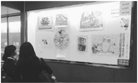
皆さんの作品が駅構内の市民ギャラリーに!