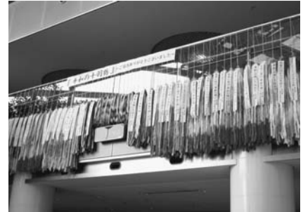
皆さんの平和への願いが込められた「平和の千羽鶴」

皆さんの平和への願いを込めた折り鶴を千羽鶴にして、市長のメッセージとともに、原爆被爆地である広島市と長崎市に届けました。来年度も実施する予定ですので、ぜひご参