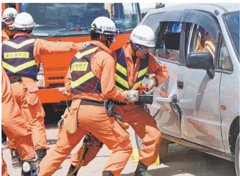
緊迫した救出訓練の様子（昨年）