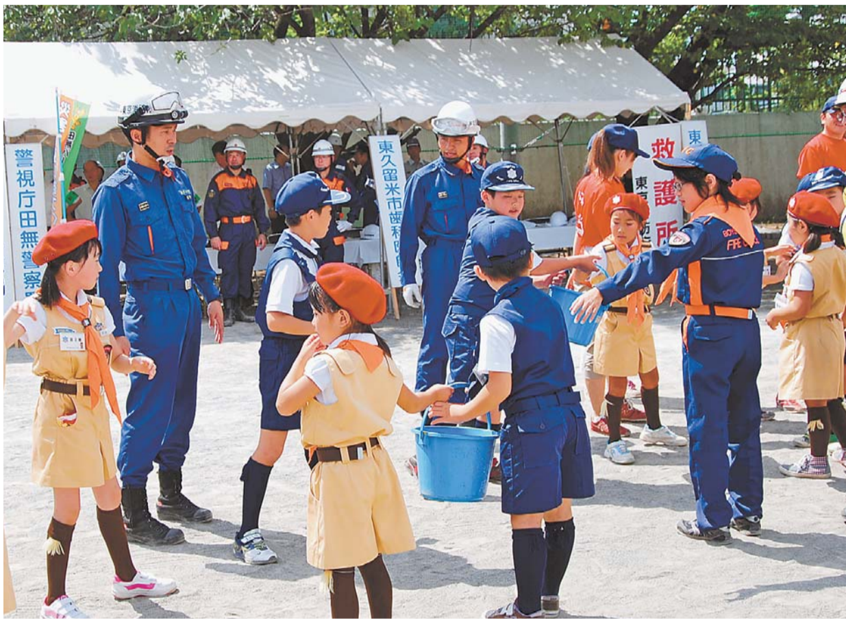
昨年8月、久留米中学校で行われた「総合防災訓練」。初期消火訓練では、バケツリレーを体験しました

市では、11月2日（土）に滝山公園で、防災関係機関や団体の皆さんと一緒に、震災発生を想定した「総合防災訓練」を実施します。 市民の皆さん、ぜひご参加ください。 詳しくは防災防犯課 ☎470・7769へ。