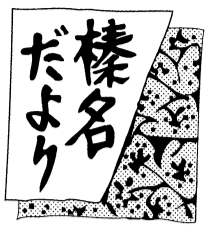
榛名神社門前そば

榛名神社の門前である社家町では、江戸時代には榛名講で訪れた参拝者へ、もてなし料理の一つとして蕎麦を振舞っていました。「講」とは、かつて、誰でも気軽にお寺や神社に参拝できなかった時代、信仰する村人のお金を集め、毎年代表者が参拝する組織のことをいいます。