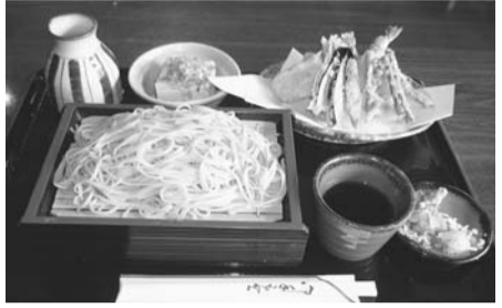
喉越しの良い新そばをご賞味ください

現代に復活した「門前そば」は、今年も8月の種まき作業の前に、榛名神社の神職による豊作祈願が行われ、白装束に烏帽子の地元の契約農家の皆さんが、一粒ずつ丁寧に種まきをしました。