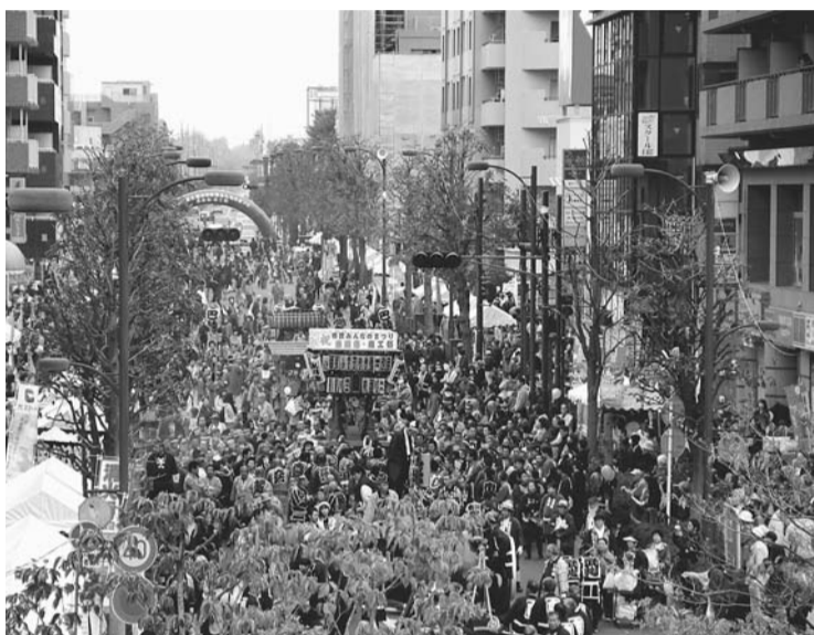
市を挙げてのお祭りに、ぜひご来場ください

市民みんなのまつりの会場は、東久留米駅西口(市役所間のまろにえ富士見通り(歩行者天国)と市役所1階屋内・屋外ひろば、市民プラザホール、西口北公園)です。 会場には各種展示会、市内の特産品や高崎市榛名地域の特産品の即売会、各種模擬店特別コーナーなどが開かれます。また、郷土芸能の披露などのほか、ステージでも盛りだくさんの催しが予定されています(雨天決行)。 【注意】同まつりの開催期間中、会場内へ自動車や自転車などの乗り入れはできません(下図参照)。