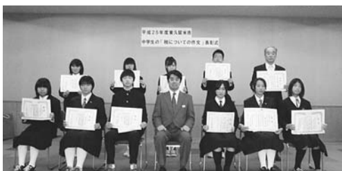
25年度中学生の「税についての作文」で入賞した皆さん

などについて疑問などがある方に「書き方」のアドバイスを行います。申告書はご自身で作成していただきます。