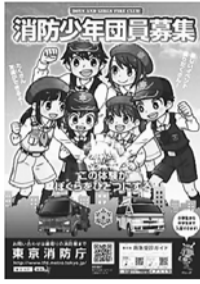
消防少年団募集のポスター

消防少年団は、防火・防災に関する知識・技術を身に付けるとともに、規律ある団体行動や奉仕活動を通じて、社会の基本的なルールをきちんと