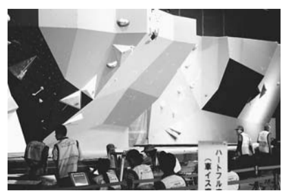
大会中のボルダリング会場の様子

25年9月28日～10月8日、第68回国民体育大会（スポーツ祭東京2013）が東京都で開催され、東久留米市では、25年10月4日～6日の3日間、山岳競技（クライミング）が開催されました。普段目にする事の少ない山岳競技ですが、大会期間中には5,000人超の方に来場していただきました。会場では、きれいな草花が植えられたプランターの設置や中学生が作成したのぼり旗の掲示、料理の振る舞いなど、日本各地から参加する選手団のために多くの歓迎装飾やおもてなしが行われました。地元東京都選手団も好成績を収め、大会を成功裏に終えることができました。さまざまな協議を行い、国体開催