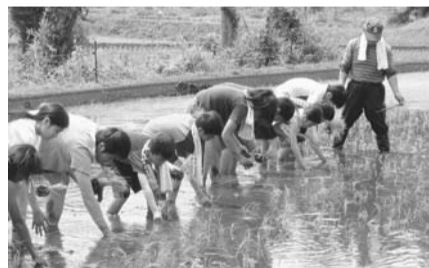
榛名地域での田植え（昨年の様子）

活動期間は4月～27年3月 野外炊事、ボランティア活動、レクリエーションなど 小学新5年生～高校新3年生 先着50人 年間1,500円