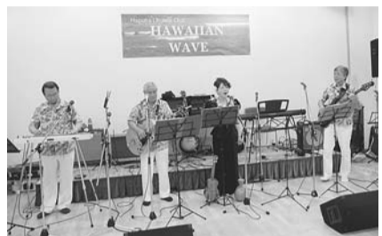
出演のブルー・レイ・ハワイアンズの皆さん

日4月19日(土)午後2時~3時(休)市役所1階屋内ひろば(休)出演はブルー・レイ・ハワイアンズ/フラ・レイ・モキハナ。主な曲目は「小さな竹の橋の下」「カイマナ・ヒラ/ハワイの蕁茸小屋」ほか(休)無料(休)当日直接会場へ(休)市民プラザ(休)470・7813