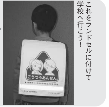
これをランドセルに付けて学校へ行こう！

市では、交通安全の観点から、毎年小学新1年生にランドセルカバーを配布しています。今年、アニメ「大きい1年生と小さな2年生」とコラボし、オリジナルデザインのランドセルカバーを1,040枚作成しました。詳しくは都市計画課☎470・7763、または企画調整課秘書広報担当☎470・7708へ。