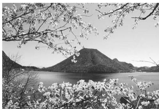
榛名湖を彩るオオヤマザクラ

榛名湖畔の遊歩道など(高崎市榛名支所地域振興課)を散策しながら、「サクラ」「ツツジ」などの花に癒されてはいかがでしょうか。