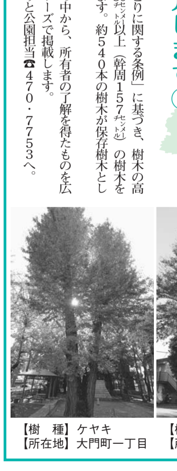
【樹種】ケヤキ 【所在地】大門町一丁目 【樹種】ケヤキ 【所在地】中央町三丁目 【樹種】ケヤキ 【所在地】南町二丁目