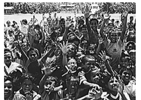
映画のワンシーン

☎5月17日(土) 午後1時半から、南部地域センター②午後5時半から、市民プラザ③5月25日(日) 午後1時半から、西部地域センター④5月31日(土) 午後2時から、東部地域センター 1,000円(4歳児～中学生は500円) 入場券は各上映会場で頒布 市民プラザ ☎470・7813または各地域センター