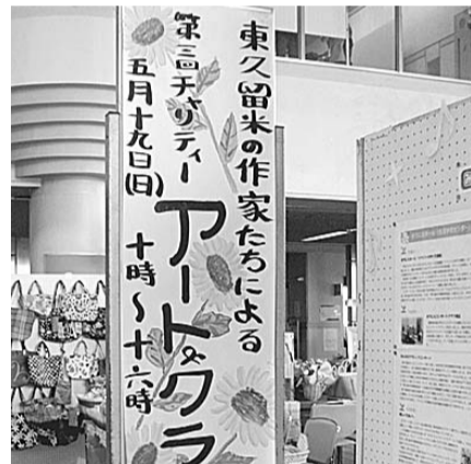
家族そろって来場ください

☎5月25日(日) 午前10時～午後4時 生涯学習センター(まろにえホール) 無料(コンサートのみ要整理券) コンサートの整理券は生涯学習センター、市民プラザ、東部・西部・南部の各地域センターで配布 生涯学習センター ☎473・7811