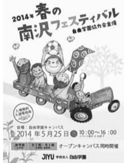
家族みんなで楽しめます

☎5月25日（日）午前10時～午後4時（入退場自由）、イベント受け付けは午後1時半まで ☎自由学園（学園町一丁目）☎ポニーの乗馬体験、ニジマス釣りを焼き魚、葉脈の標本作り、ネイチャーツアー、弦楽合奏・吹奏楽を楽しむ会、ミニコンサート（午後3時から）、出張レストラン、カフェなど ☎入場料無料（一部有料、要事前予約の企画あり）☎駐車場はありません ☎同学園 ☎428・2123（ http://www.jiyu.ac.jp/ ）