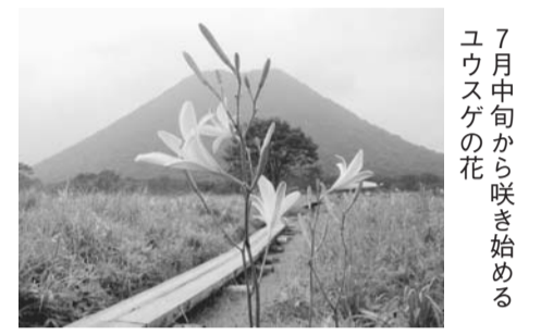
7月中旬から咲き始めるユウスケの花