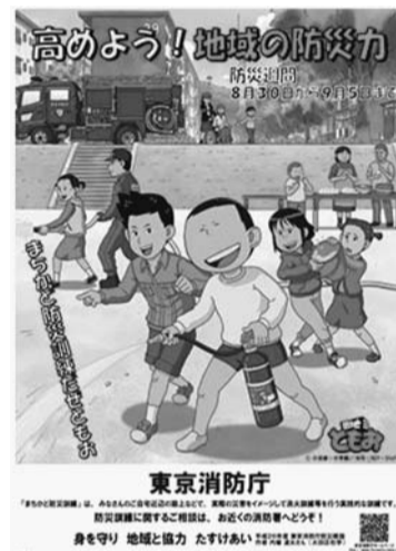
東京消防庁防災週間ポスター

立川・池袋・本所の各防災館は、無料で気軽に楽しみながら防災を学べる「体験型学習施設」です。館内には地震・消火・煙・応急手当などの体験施設があるほか、防災に関する展示や防災映画を見ることができます。