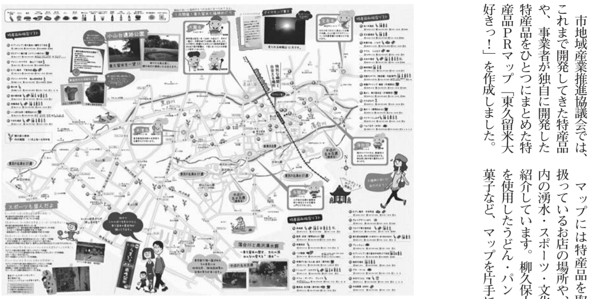
特産品PRマップ「東久留米大好きっ!」

市地域産業推進協議会では、これまで開発してきた特産品や、事業者が独自に開発した特産品をひとつまとめた特産品PRマップ「東久留米大好きっ!」を作成しました。菓子など、マップを片手に身近なグルメを探しに市内を巡ってみませんか。