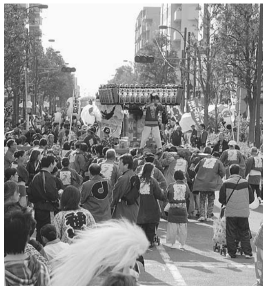
秋深まる季節、皆さんでご来場ください

今年も「市民みんなのまつり農業祭・商工祭」が11月8日(土) 午前11時から9日(日) 午前10時から2日間、いずれも午後4時まで開催されます(雨天決行)。 会場では、展示会や特産品の即売会をはじめ、各種模擬店、ステージでの実演など、多くのイベントが行われます。ぜひ家族や友達の皆さんとご来場ください。 詳しくは産業振興課 ☎470・7743へ。