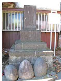
B 石橋供養塔・カ石

在原業平の東下りの伝説にまつわる「笠懸の松」周囲を圧倒して黒松がそびえ、昭和39年(1964)東京都天然記念物となりましたが昭和47年(1972)に落雷の被害にあい、切り株だけを残して伐採されました。現在の松は2代目です。