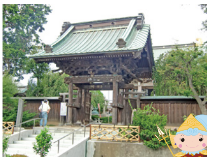
C 多間寺 多間寺山門

嘉永5年(1852)頃に建立。控え柱上部の獅子鼻などの彫刻には、江戸末期の地方建築技術の特徴が表れています。