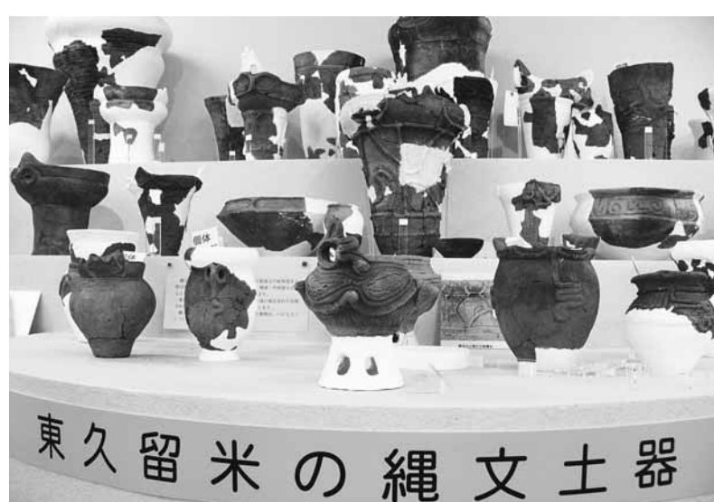
郷土資料室(わくわく健康プラザ内・8月1日オープン)