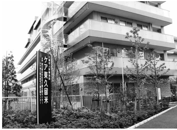
6月オープン在宅介護支援センター(介護老人保健施設「ケア東久留米」内)