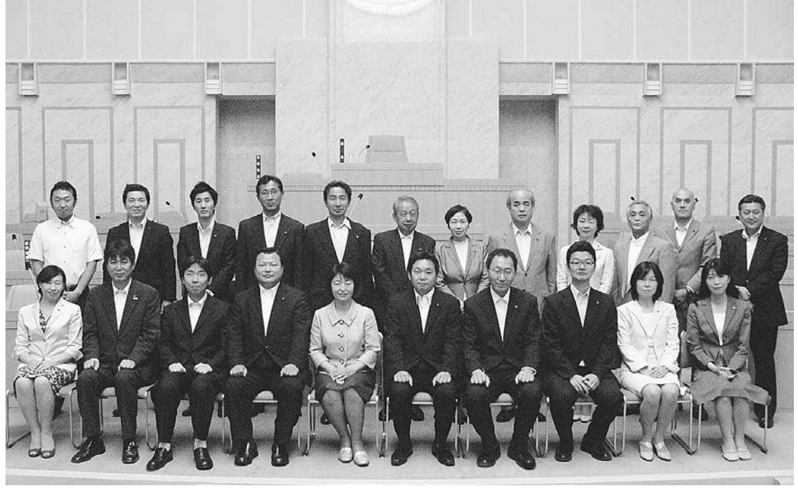
東久留米市議会では、5月から10月まで節電対策の一環として、軽装(クールビズ)での議会運営を実施しています。

就任のごあいさつ 私どもは、去る5月20日開催の市議会臨時会において多数議員の推挙により、議長ならびに副議長に就任することとなりました。東日本大震災という戦後最大級の大災害の発生から